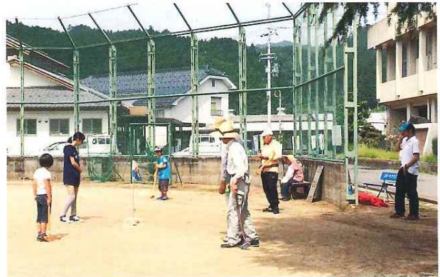
世代間交流ふれあいグランドゴルフ大会 6月29日(日)