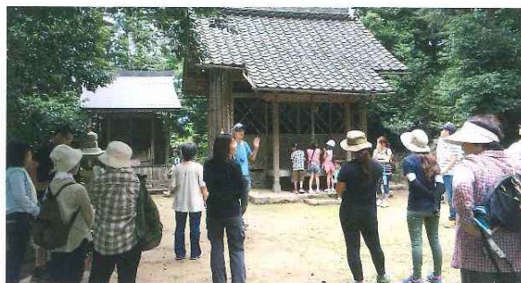
第12回ふれあいウォーキング (与布土を知ろう) 6月27日(土)