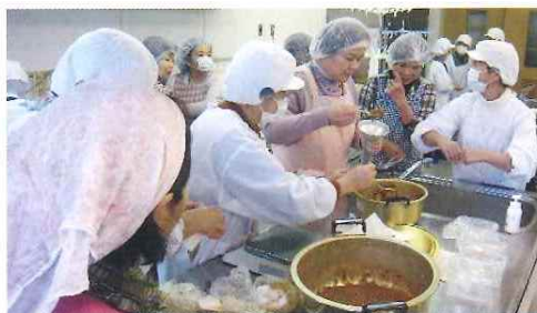
本山地区交流会 加工品づくり体験会 平成26年3月27日(木)