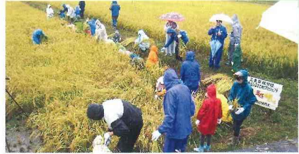
第4回三菱電機労組 与布土ふるさと村秋の五感体験スクール 9月15日(日) 月見団子づくり体験(左) 小雨の中での稲刈り体験(右)