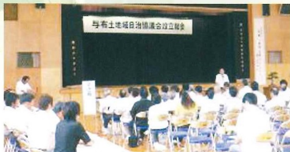
与布土地域自治協議会設立総会 6月17日(日)