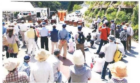
与布土ダムふれあいウォーキング 山東3自治協議会合同事業 6月3日(土)