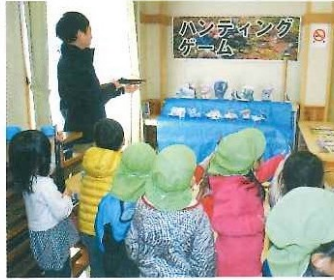
第2回開催 平成30年3月17日(土)