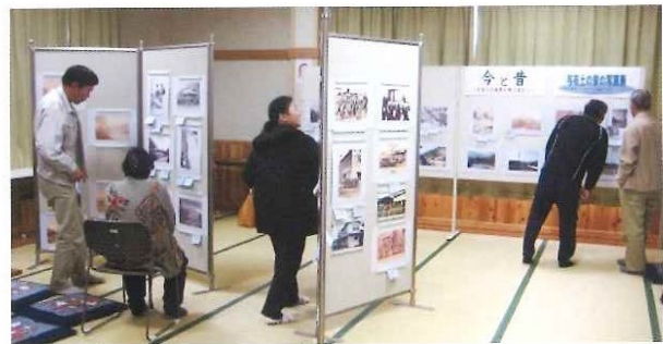
与布土の昔の写真展 平成22年3月23日(火)～4月22日(木)

3月 「市島野菜直売所 ダイニング茜」視察研修 「井原市」ふれあいサロン視察研修