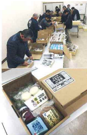
与布土発 「ふるさと小包便」発信 11月~12月