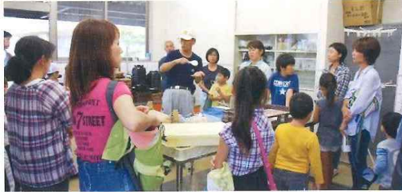
第6回三菱電機労組 与布土ふるさと村秋の五感体験スクール 9月14日(日)