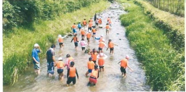
第7回わくわくキャンプ 7月16日(土)～7月17日(日)