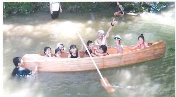
第4回わくわくキャンプ 7月24日(土)～7月25日(日)