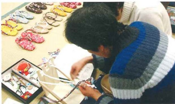
「布ぞうり」作り方講習会 平成20年 1月21日(月)・ 1月28日(月)・2月4日(月)