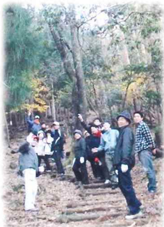
第10回ふれあい ウォーキング 朝来山雲海登山 12月1日(日)