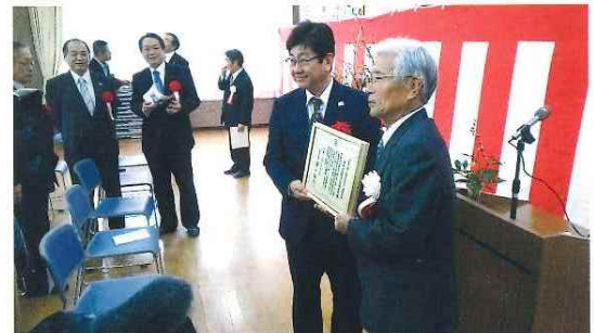
「エネルギー自立のむら」認定式 太陽光発電所運転開始 平成27年1月13日(火)