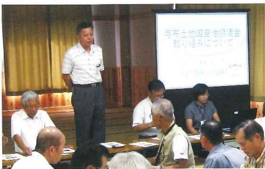
視察の受け入れ 5月～平成21年3月

3月 都市農村交流活動 (うどん作り体験:アエルクラブ(児童)) 与布土川清掃活動