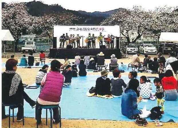
第2回ふるさと交流お花見会 4月3日(日) シルバー人材センター、健康福祉大学、 よふど温泉、与布土地域自治協議会 合同開催