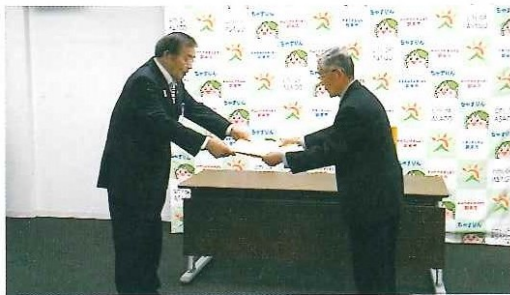
総務大臣賞受賞伝達式 (朝来市長)12月15日(金)