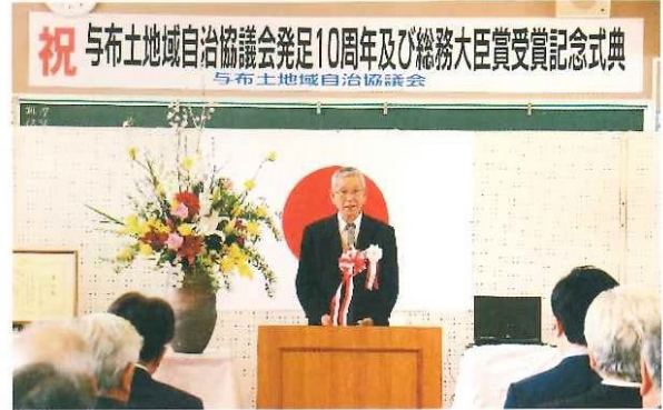
与布土地域自治協議会発足 10周年記念 及び 総務大臣賞受賞記念式典 平成30年3月10日(土)