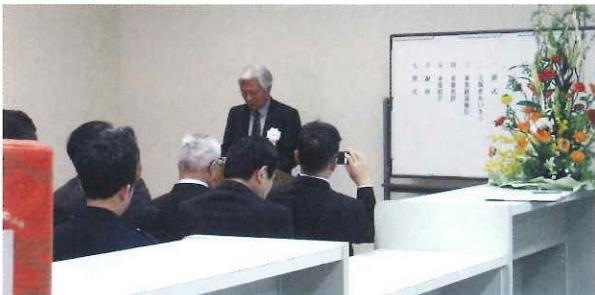
与布土地域自治協議会新事務所開所式 (旧朝来郡農協与布土支所) 平成25年3月2日(土)