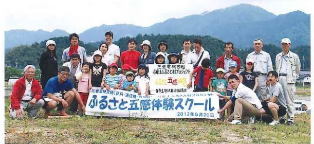
第1回三菱電機労組 与布土ふるさと村春の五感体験スクール 5月20日(日) 都市農村交流連携促進事業