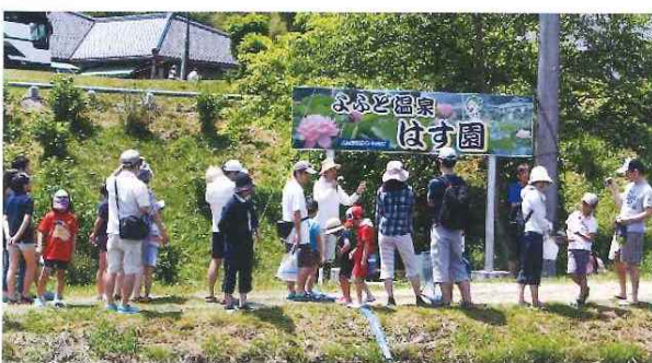
第7回三菱電機労組 与布土ふるさと村 春の五感体験スクール 5月17日(日)