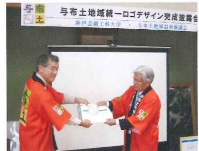
与布土地域統一ロゴ デザイン完成披露会 神戸芸術工科大学 平成24年 3月29日(木)