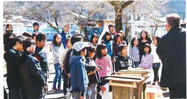
がんばれ元気ツズ(子どもたちの都市農村交流) 「ミツバチの巣箱づくり」 平成23年3月5日(土)