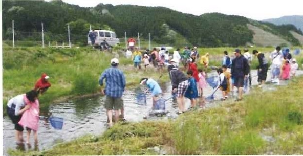
第3回三菱電機労組 与布土ふるさと村春の五感体験スクール 5月19日(日) 都市農村交流連携促進事業