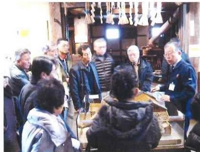
灘の酒蔵めぐり 平成24年 2月19日(日) 本山ふれあいのまちづくり 協議会交流事業