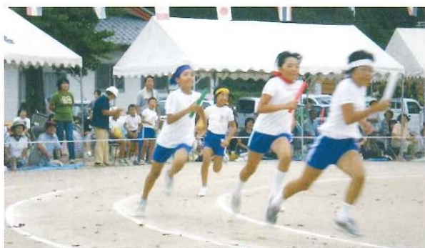
第27回与布土地区運動会 9月16日(日)