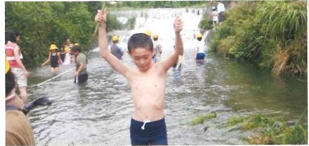
第3回わくわくキャンプ 7月18日(土)～7月20日(月)