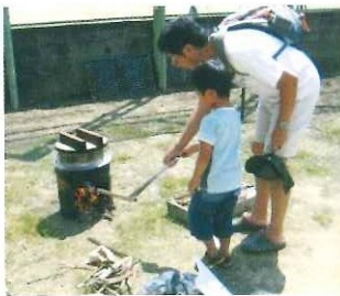
第10回三菱電機労組与布土ふるさと村 秋の五感体験スクール 9月11日(日)