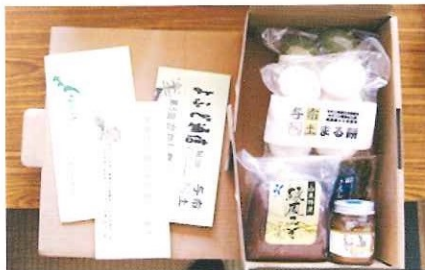
与布土発「ふるさと小包便」発売開始 11月～12月