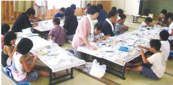
夏休み「ちびっ子集まれ」 7月～8月