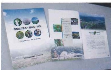
交流体験ガイドブック 「与布土で遊ぶ・感じる・学ぶ」の発行