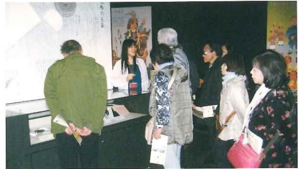
本山地区交流会 地域の歴史と田舎暮らし交流会 平成29年3月18日(土)～3月19日(日)