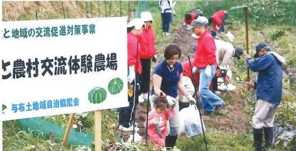
本山児童館(神戸市東灘区) 自然体験交流 10月23日(日)