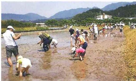
第9回三菱電機労組 与布土ふるさと村春の五感体験スクール 5月15日(日)