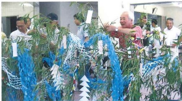
本山地区交流会(おやじの会) 7月3日(土)～7月4日(日)