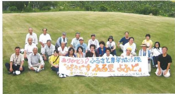
ふるさと青年協力隊公園整備などに協力 9月5日(金)～6日(土)