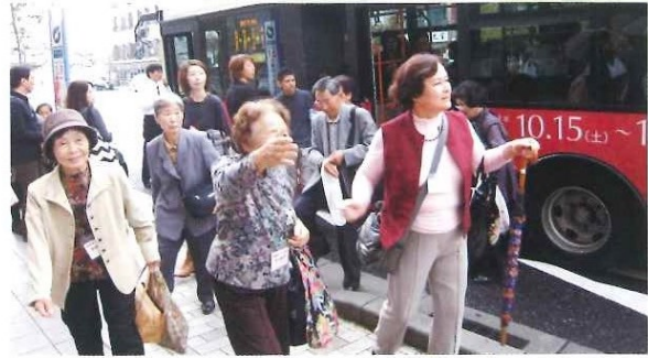
ひがしなだスイーツめぐり 11月6日(日) 本山ふれあいのまちづくり協議会交流事業