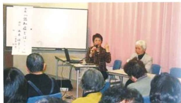
交流ふれあいサロン「あつまり処よふと」 AED講座、認知症講座 平成21年1月17日(土)