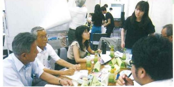
兵庫県ふるさと交流会テーマ発表 8月30日(水)