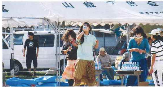
第33回与布土地区運動会 10月13日(日)