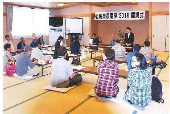
但馬楽農講座2016の開講 開講式 5月7日(土) 平成28年度～30年度(3年間)