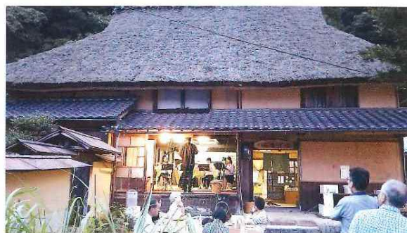
ほたるの夕べin喜古里 6月12日(金) アンサンブル ミニコンサートの開催