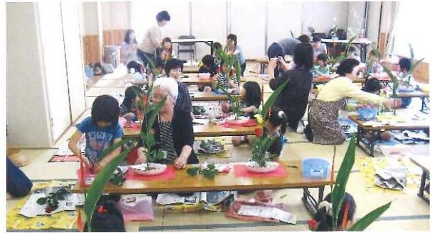
与布土っ子広場(放課後子供教室) 生け花体験 6月12日(土)