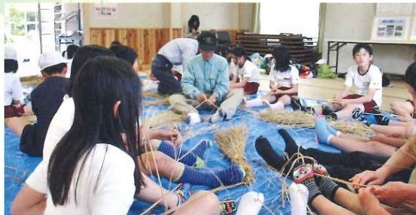
県内小学校 自然体験学校 地域交流 わら草履づくり体験 加古川陵北小学校 5月23日(月)