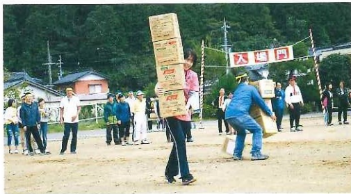
第36回与布土地区運動会 10月9日(日)