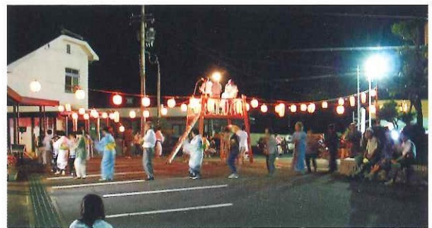
第1回地域盆踊り大会 8月18日(土)