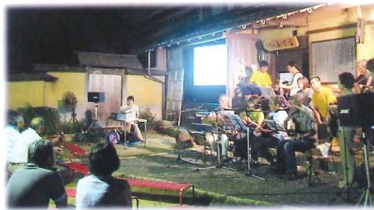
みんなで歌おう コンサートの開催 「農家レストラン 喜古里」 9月4日(土)