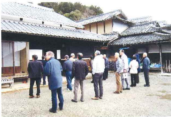
地域活性化研修 視察「原始人村 農家民宿」加西市(左) 平成28年1月30日(土)午前