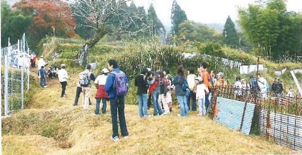
史跡めぐりふれあいウォーキング 迫間 大林寺～石積双室古墳 11月11日(日)