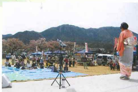
第1回ふるさと交流お花見会 4月12日(日) シルバー人材センター、健康福祉大学、よふど温泉、 与布土地域自治協議会 合同開催