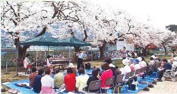
お花見コンサート 4月15日(日)