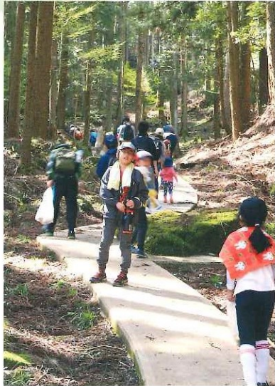
ふれあいウォーキング 春編 4月22日(土)