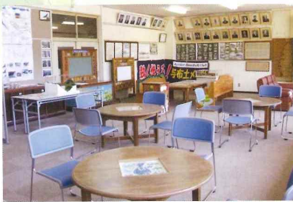
地域交流室オープン 朝来市高齢者活力創造センター開所 4月26日(土)