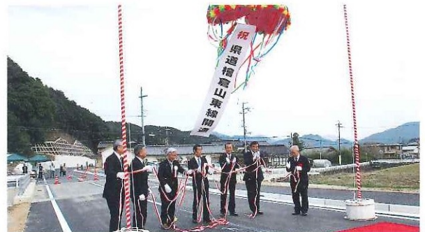
県道檜倉山東線開通式 地域交流イベント開催 平成25年3月24日(日)