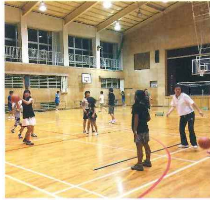
生涯スポーツ講座 毎週1~2回開催(年間)