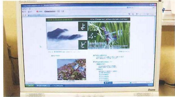
与布土地域自治協議会 ホームページ開設 12月1日(土)