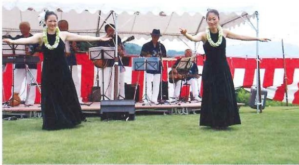
よふど温泉 ハスマつり 都市農村交流事業(本山地区との交流) サーフライダースの演奏と フラダンスの共演 7月22日(日)