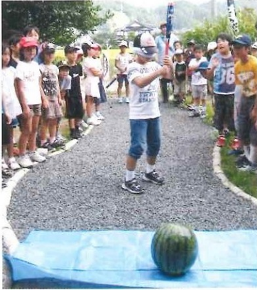
本山児童館(神戸市東灘区) 自然体験交流 8月25日(水)