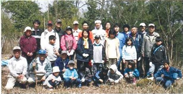
ふれあいウォーキング「衣笠山登山」 4月18日(日)