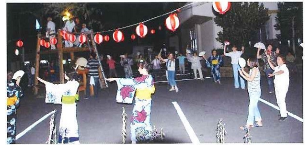
第2回地域盆踊り大会 8月18日(日)