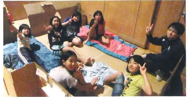
第5回わくわくキャンプ 7月27日(土)～7月28日(日)