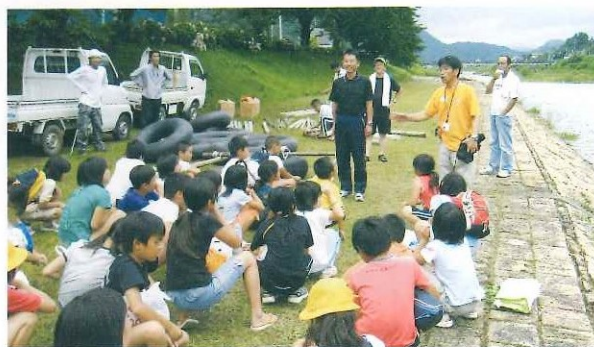
第1回わくわくキャンプ 7月20日(金)～7月22日(日)