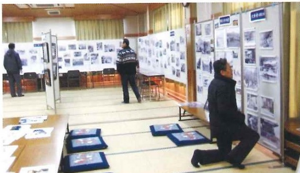
与布土の昔の写真展 第2弾 平成23年1月1日(土)~1月11日(火)