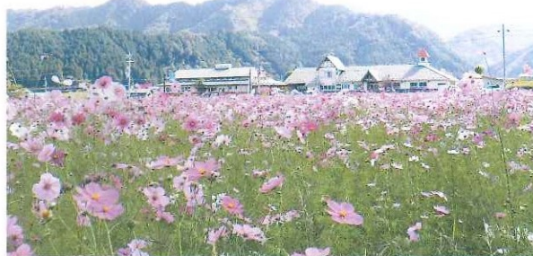
休耕田を活用した景観形成事業 コスモスの栽培 8月～11月