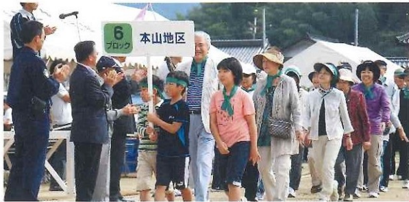
第32回与布土地区運動会 本山チーム参加による交流運動会の開催 10月7日(日)

当該年度は、自治協発足5年目となることから、まちづくり計画の見直しを行うために「ふるさと自立計画推進モデル事業(県)」の採択を受けてアンケート調査を実施し、第2期計画を作成しました。 「食と地域の交流促進対策事業(国)」については、2年目事業に着手し、交流体験ガイドブック(与布土で遊ぶ・感じる・学ぶ)の印刷製本や東近江市、香美町米地加工所への視察、料理教室の開催、お米の味比べイベントなどを開催しました。