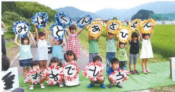
第1回コウノトリ放鳥式典 三保放鳥拠点 7月18日(木) 「みほと」「あさひ」の放鳥