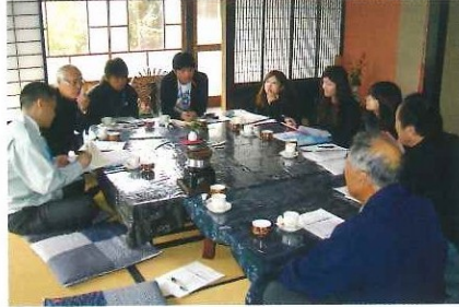
大学生によるむらづくり 提案会(県事業) 8月2日(月)及び 11月2日(火)~11月3日(水)