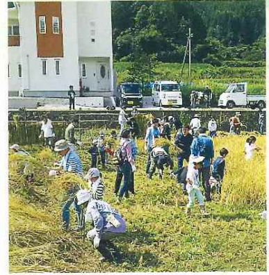
第8回三菱電機労組 与布土ふるさと村 秋の五感体験スクール 9月13日(日)