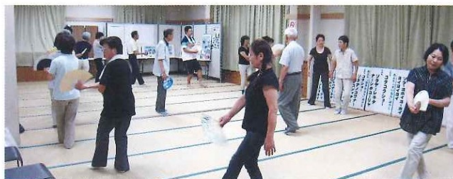
盆踊り講習会 7月～8月