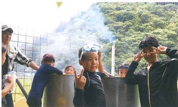
第8回わくわくキャンプ 7月15日(土)～7月16日(日)