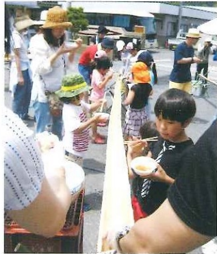
第11回三菱電機労組 与布土ふるさと村 春の五感体験スクール 5月21日(日)