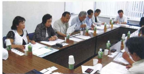
本山地区交流会(神戸) 交流事業打合せ会 6月11日(土)