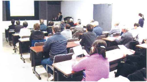
「先端医療センター」神戸市(右) 平成28年1月30日(土)午後