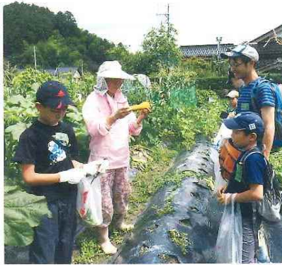
第6回わくわくキャンプ 7月18日(土)~7月19日(日)