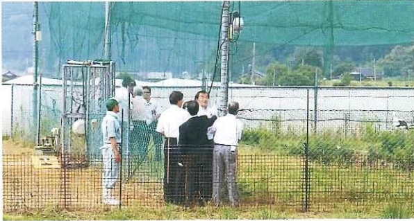
第4回コウノトリ放鳥式典 三保放鳥拠点 6月21日(火)