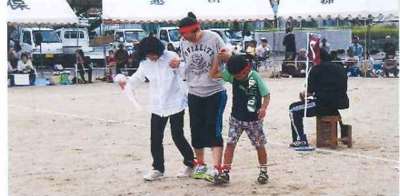
第34回与布土地区運動会 10月12日(日)