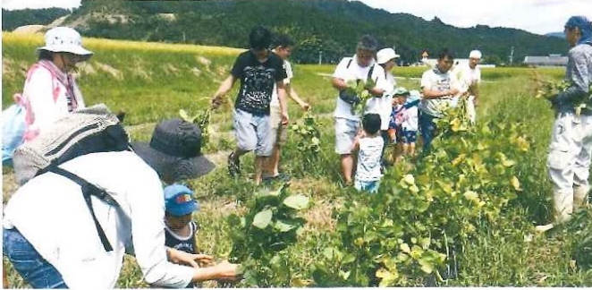
田舎の子育て体験会 8月20日(日)