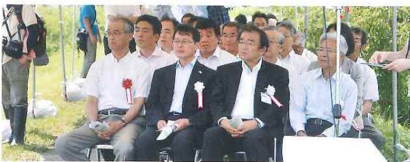
第3回コウノトリ放鳥式典 三保放鳥拠点 6月25日(木)